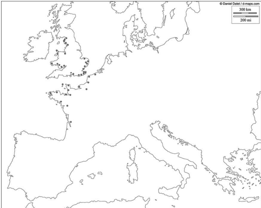
Figure 2 – Localisation des forteresses côtières de l'Antiquité tardive sur les côtes de la Manche et de l'Atlantique

zones de défense côtière tardives, portant le nom de Litus saxonicum pour sa partie insulaire – ou plus exactement, pour la partie orientale de l'île de Bretagne – et de Tractus armoricanus et nervicanus pour sa partie continentale, et dont le document administratif du début du v e siècle, dit Notitia Dignitatum , recenserait les garnisons 6 . Ce double réseau de forteresses côtières aurait été destiné, selon l'hypothèse classique, à protéger les côtes de la Gaule et de la Bretagne insulaire des attaques de pirates francs et saxons, venues d'au-delà du limes rhénan, et dont les textes attestent