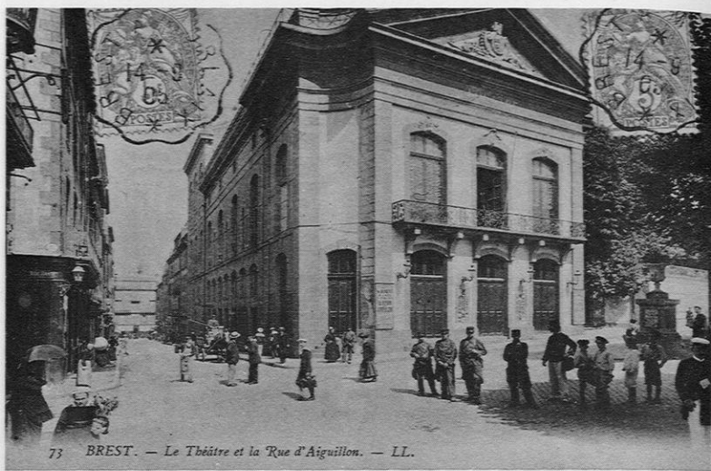
73 BREST. — Le Théâtre et la Rue d'Aiguillon. — LL.

Le théâtre de Brest, œuvre de Dumont, fut le premier édifice de ce type construit en Bretagne.