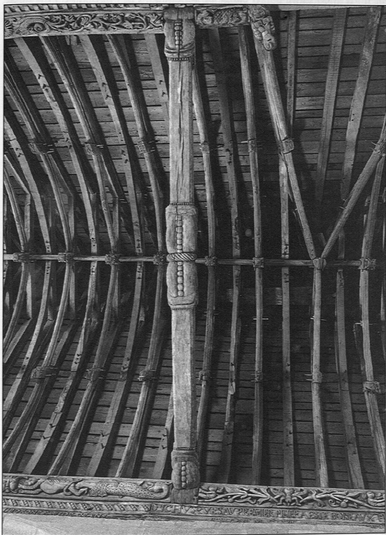
Charpente et sablières de la nef