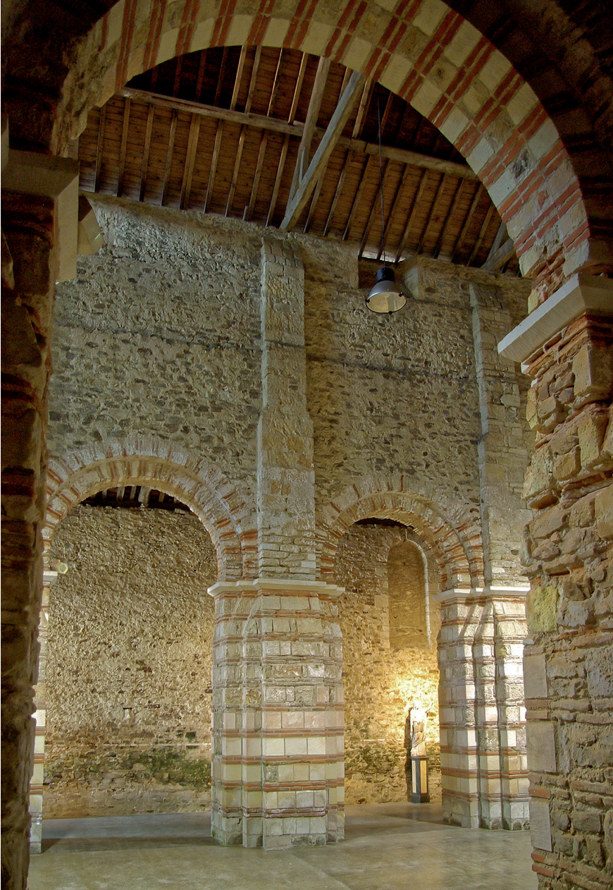
Figure 6 – Saint-Philbert-de-Grandlieu, abbatale, vue partielle de la nef ; en arrière, une des fenêtres de la première église carolingienne