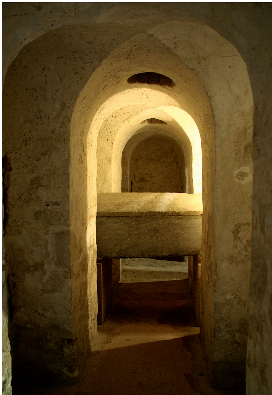
Figure 4 – Saint-Philbert-de-Grandlieu, abbatale, confession et tombeau de saint Philibert