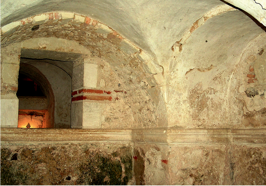
Figure 3 – Saint-Philbert-de-Grandlieu, abbatale, vue partielle de l’oratoire cruciforme de la seconde église carolingienne (cl. D. Prigent)