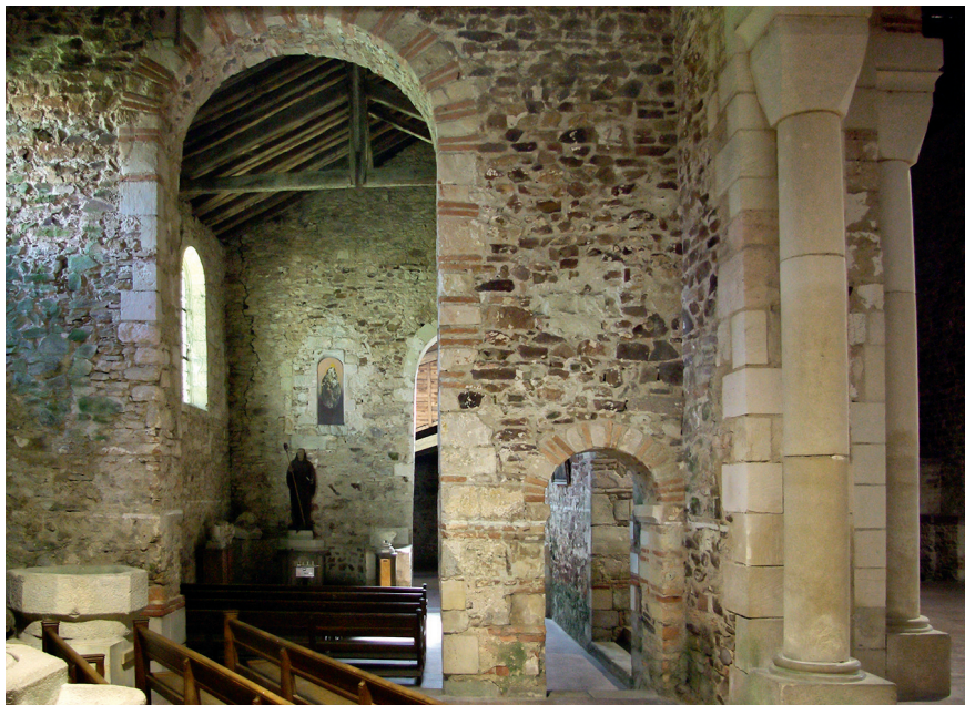
Figure 1 – Saint-Philbert-de-Grandlieu, abbatale, première église carolingienne : entrée du couloir cernant l'abside et ouverture (transformée) de l'absidiole nord