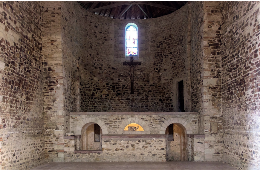
Figure 5 – Saint-Philbert-de-Grandlieu, abbatale, abside, le chœur surélevé au-dessus de la crypte était accessible par un escalier aujourd’hui disparu