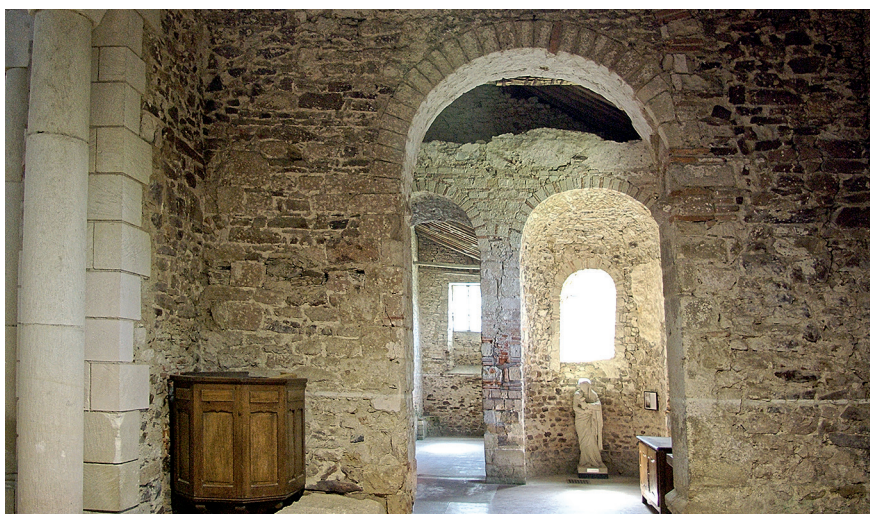
Figure 2 – Saint-Philbert-de-Grandlieu, abbatale, bras sud du transept, l'ancienne ouverture de l'absidiole primitive a été transformée et le passage vers le couloir, obturé ; au second plan, absidiole de l'annexe sud et passage anciennement voûté